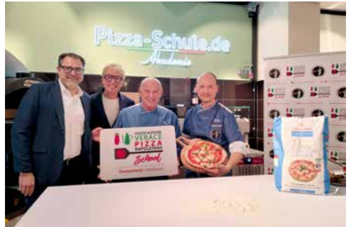
Auszeichnung für die Pizza-Schule in Siegelsdorf.

Die Technik neapolitanischer Pizzabäcker ist als immaterielles Kulturerbe der Menschheit anerkannt. Über die Einhaltung der hiermit verbundenen Richtlinien wacht die Associazione Verace Pizza Napoletana (AVPN).