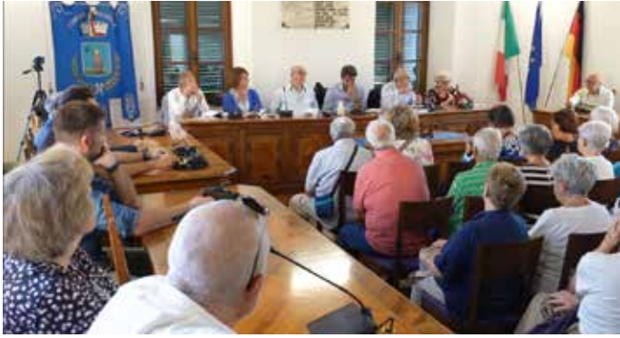
Präsentation von „La Triste Rubrica“ im Rathaussaal von Sovicille.

Die Präsentation des mittlerweile zweiten Buches erfolgte just am erstmalig abgehaltenen „Nationalen Gedenktag für die italienischen Militärinternierten in deutschen Lagern“.